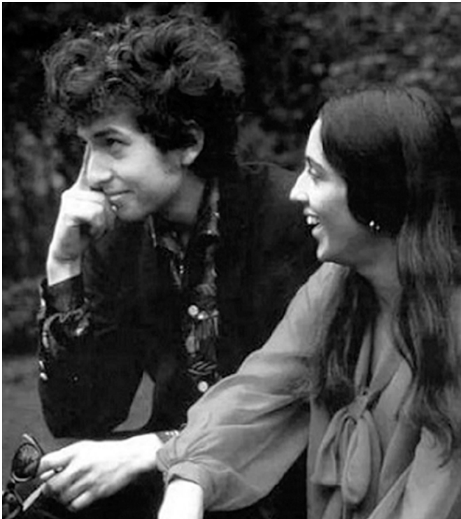
Боб Ділан і Джоан Баез

Я був на роздоріжжі свого життя, як і багато інших молодих людей початку сімдесятих. У цей неспокійний період історії молодь була збентежена та розчарована війною, бідністю та глобальною нерівністю, та прагнула розширення прав і можливостей. Ця епоха була чітко визначена в книзі Стівена Спендера «Рік молодих повстанців» (до речі, примірник книги з автографом подарував мені покійний міжнародний президент Теософського товариства, Брат Джон Коутс) про студентські повстання в Празі, Сорбонні і Берклі протягом 1960-х років. Том Гейден і Регіс Дебре були новими аватарами, а вірші протесту Аллена Гінзберга читали на площах коледжів. Студентський рух викристалізувався з антивоєнних протестів і з'явилася нова спільнота допитливих шукачів: їх по-різному описували, як «діти квітів» і «покоління Вудстока».