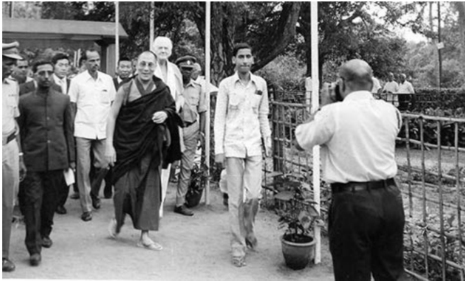
1975 рік, сторіччя Товариства, Далай-лама був почесним гостем, за ним Джон Коутс

зібрання теософів з усього світу. Це дало мені чудову можливість зустрітися з духовними шукачами з усіх куточків – від Колумбії до Нової Зеландії; Еко-Воїни, практикуючі йоги, пацифісти, суфії, поети-альтернисти, психоделічні поп-виконавці, філософи та інтелектуали всіх мастей і переконань. Далай-лама був почесним гостем, і він багато говорив про любов і співчуття. Я мав нагоду поговорити з цією великою душею разом із кількома іншими, коли Його Святість йшов до свого помешкання.