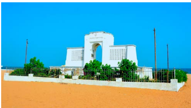
Відома пам'ятка на пляжі Елліот

Н апочатку сімдесятих років я жив у квартирі на узбережжі Елліотс в Адьярі, в місті Мадрас, нині відомому як Ченнаї. У мої часи пляж був відомий як стоянка для моторизованих караванів, що подорожували дорогою зі Скандинавії та внутрішньої частини Європи до Австралії через порт Келанг у Малайї.