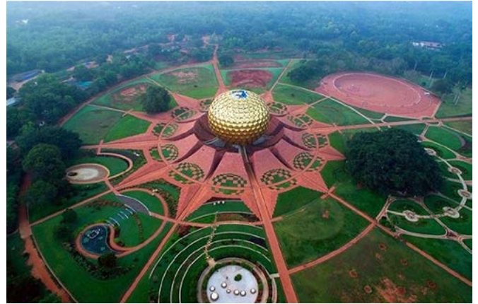
Ауровіль Шрі Ауробіндо в Пондічеррі.