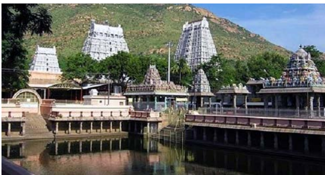
Ашрам Рамана в Тіруваннамала

Після столітньої Конвенції багато молодих людей залишилися в Адьярі та поблизу нього, здійснивши таку довгу подорож. Деякі з них хотіли відвідати ашрам Рамана в Тіруваннамалайї та Ауровіль у Пондічеррі.